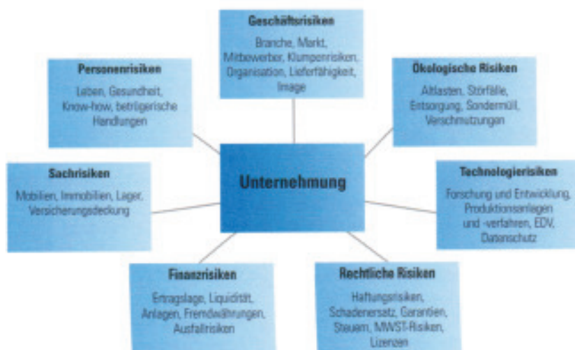
Mögliche Risikoarten im Unternehmen